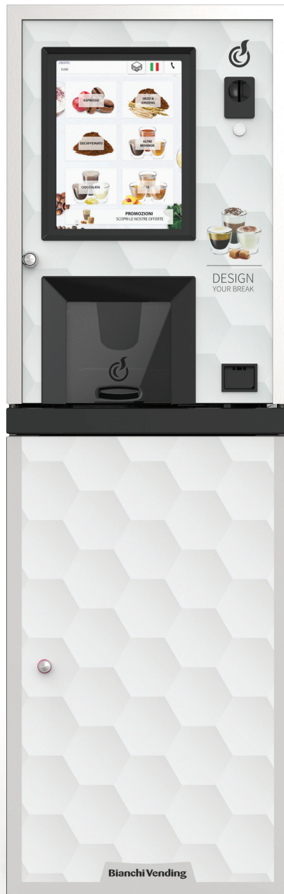
LEI250 TOUCH15" + SCHRANK + AUFKLEBER-SET MIT DER GRAFIK "DESIGN YOUR BREAK" (OPTIONAL)