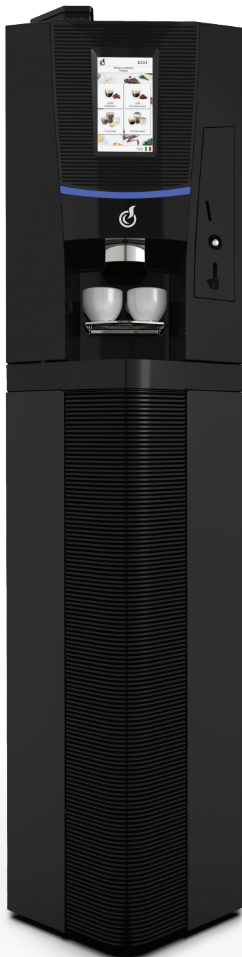
TALIA TOUCH 7" + SCHRANK