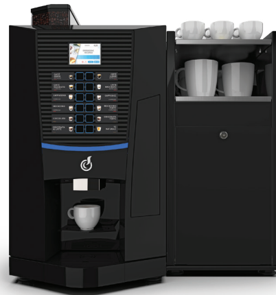
TALIA EASY + FRISCHMILCHMODUL (optionales Zubehör)

TALIA, die halbautomatische Lösung für einen kompletten und effizienten Kaffeebereich mit einem Design, das jeden Raum aufwertet.